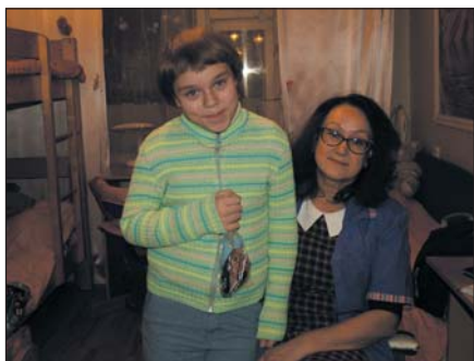
Fra barnehjemmet LIFE i St.Petersburg.

Busstur fra Ålesund, Bergen og Kristiansand, ca. 25 personer i hver turistbuss, resten av lastekapasiteten er fylt opp med innsamlede varer. Første stopp er Oslo med fellessamling på hotellet, hvor vi også overnatter. Videre til Stockholm og nattseilas med turistferje over til Finland. Så drar vi over grensen til Russland og Vyborg, hvor vi starter utdeling av varer. Vi drar til Vyborg baptistkirke som er vår base mens vi er i Vyborg, men vi overnatter og spiser frokost på Hotell Drushba.