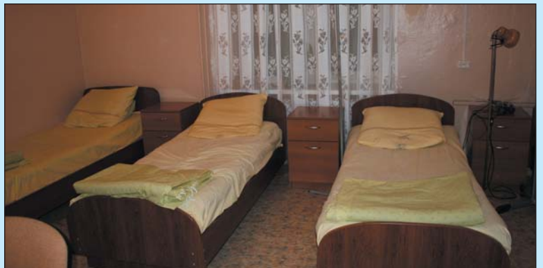
Sykehuset i Kondratjevo har nå noen få senger i sin poliklinikk.

Lokalsykehuset like innafor grensa er nå nedlagt. Selve sykehuset som ble drevet i 2. etasje, står tomt. Det er åpnet dagklinikk/poliklinikk i 1. etg, hvor de også har noen senger. Hit kan lokalbefolkningen komme for å få medisiner, intravenøs veske og annen oppfølging. Vi har besøkt dette sykehuset i mange år, og vil fremdeles besøke medarbeiderne for å få vite hva de trenger.