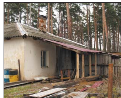
Forbedring på gang.

mange vis. Men gleden over å få besøk av noen som bryr seg og som kommer med mat, er ubeskrivelig. Dette har på mange måter åpnet våre øyne for de store forskjellene mellom fattige og rike. Selv om vi visste det fra før, er det sterkt å se det med egne øyne. Kjenne lukten. Se de kummerlige forholdene. Møte de gamle som ikke har noe, småbarnsforeldre og barn, tilsynelatende uten fremtidshåp. Vi er med og viser at vi bryr oss, og gir dem et lite håp om bedring.