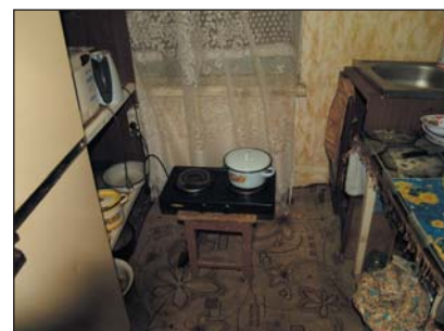
Kjøkkenet til en gammel dame.