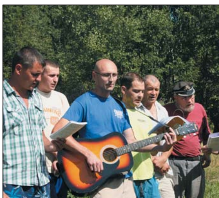
Guttene ved Håpets Hus synger alltid for oss når vi kommer på besøk.