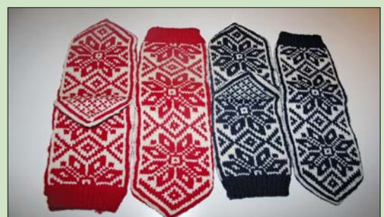
Mange fine gevinster på samtlige av basarene.

Følg med i lokale kunngjøringer og vær velkommen på basar !