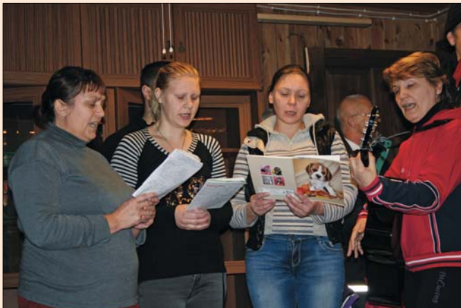
Noen av jentene ved Bethesda, høsten 2013. De synger evangeliske sanger for oss på loftet. Det er gripende å høre deres vitnesbyrd om nytt liv etter at de fikk hjelp via sentrene.