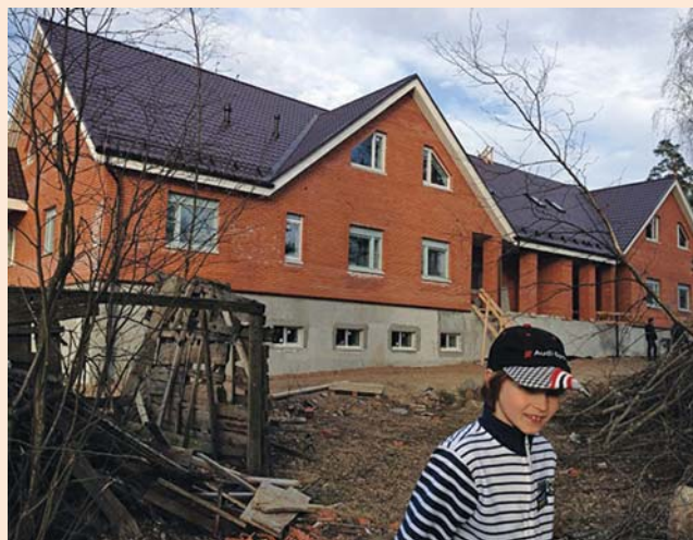
Dette bildet av barneheimen ble tatt lørdag 26. april. Nå er vi i ferdigstillingsfasen.