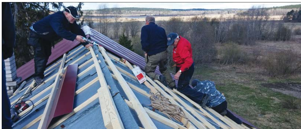
«Takdugnadgjengen» sendte oss dette bildet fra deres arbeid nå i 2014.

Seks snekkerdyktige karer melder fra Russland i det bladet går i trykken, at de har lagt nytt tak på Håpets hus. Vi gleder oss over de villige mennene som reiser bort og jobber, samt de glade guttene som får skikkelig tak over hodet.