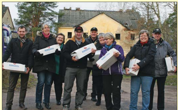
Under matkasseutdelingen gikk vi i grupper og besøkte mange fattige.