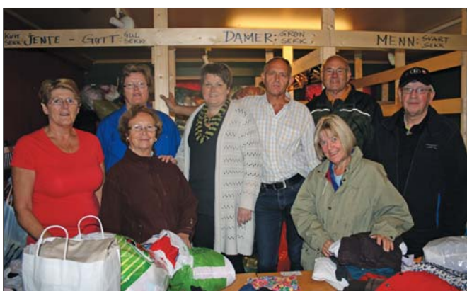
Noen fra dugnadsgjengen som pakker varer på lageret i Ålesund.