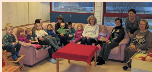
Her er alle samla i sofakroken ved Rovde barnehage.