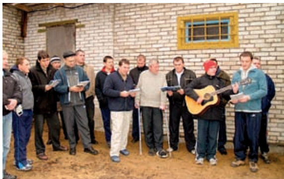
Mennene på senteret høsten 2008 synger for gjestene fra Vyborghjelpen.

I Russland er alkoholproblemene enorme, det er også narkotikaproblemene. Men Baptistkirkens Union ønsker å gjøre noe for å hjelpe disse menneskene. Det får Vyborghjelpen være med på, og mange Vyborg-venner har fått være med utpå landsbygda sett Håpets Hus. Som en