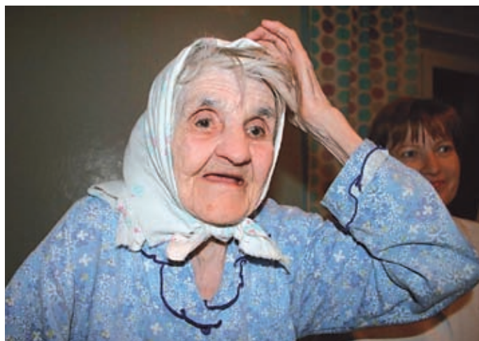
Denne damen på sykehuset i Kondratjevo takker varmt for hjelpen fra Norge.