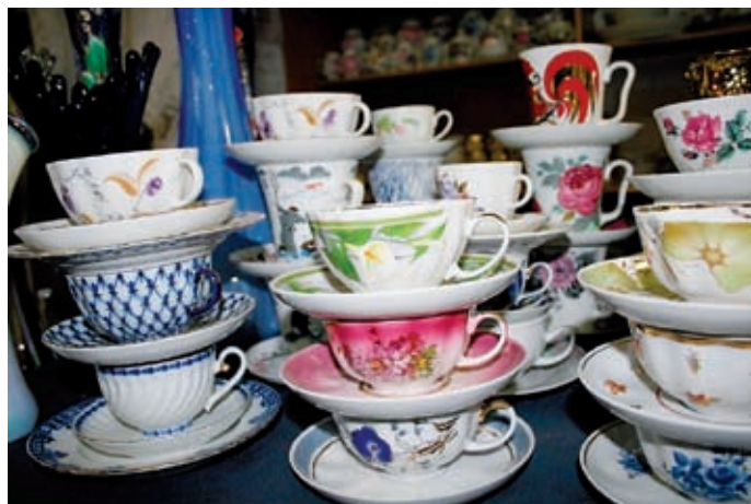
Noen av disse russiske koppene fra markedet i Vyborg havner som gevinster på basarer i Norge.