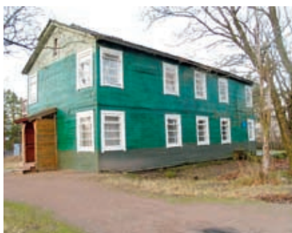
Poliklinikken ved sykehuset i Kondratjevo.