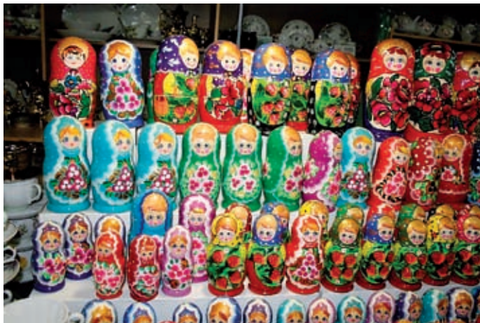
Babruska fra markedet i Vyborg havner kanskje som norsk basargevinst.

Vyborghjelpens basarer er ryggraden i det inntektsgivende arbeidet til Vyborghjelpen. Over 50% av inntektene kommer årlig fra basarene. I 2008 var basarene på hele 540.000. Takk til trofaste medarbeidere i Åseral, Valderøy, Blomsterdalen i Bergen, Huglo og Fitjar, Vanylven, Brattvåg og Herøy.