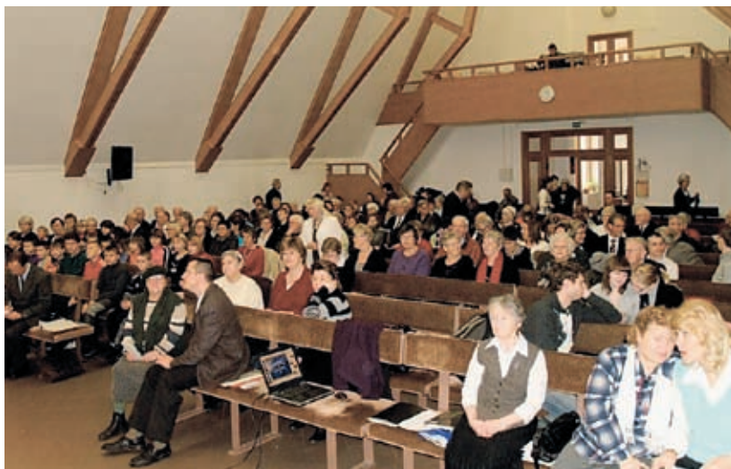
Vyborghjelpen deltar på søndagens gudstjeneste i baptistkirken hver gang vi er på besøk i Vyborg.

I tillegg har menigheten bruk for barneklær og sko til sin lille "bruktbutikk" hvor fattige kan komme og hente det de har bruk for, selv om det er smått med penger.