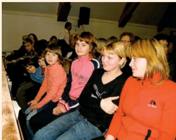
Barnearbeiderne i kirken henter mange barn fra sykehus og barnehjem til kirken søndag. De bærer også på en høyst levende visjon om å starte eget barnehjem like ved kirken.