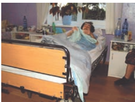
Sykehussengene som vi hadde med fra Sørlandet høsten 08, ble øyeblikkelig tatt i bruk.

Vi trenger 21.000 kroner til dette prosjektet i 2009.