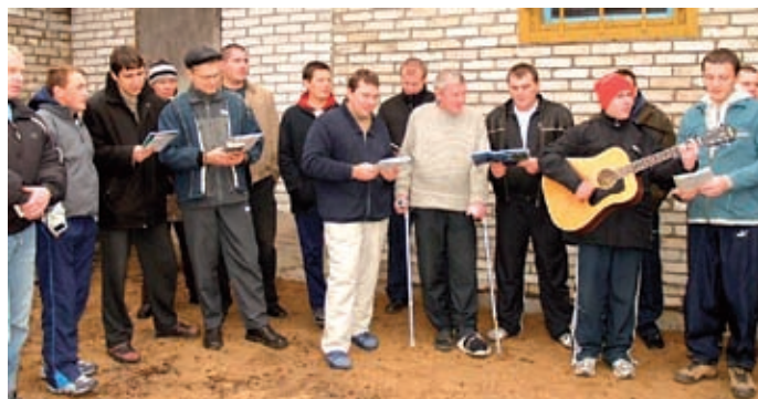
Håpets Hus har gitt livet nytt innhold for mange rusmisbrukere. Her synger og vitner de om sitt møte med Gud.

Vyborghjelpen drives i regi av Si-REISER. Vi ønsker å hjelpe folket i Vyborg og St. Petersburg-området materielt og åndelig. Vi ønsker å gi et håndslag til barnehjem, sykehus, menigheter, skoler, institusjoner, familier og enkeltpersoner i vårt naboland Russland.