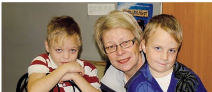
Slitne men tillitsfulle gitar på 6 og 8 år vann redaktørens hjarte.